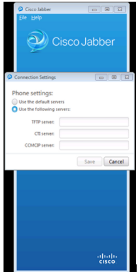
Phone Mode Only

在左侧的映像中，Jabber处于完全统一通信(UC)IM and Presence模式。可以选择服务器类型，并输入服务器的登录信息。