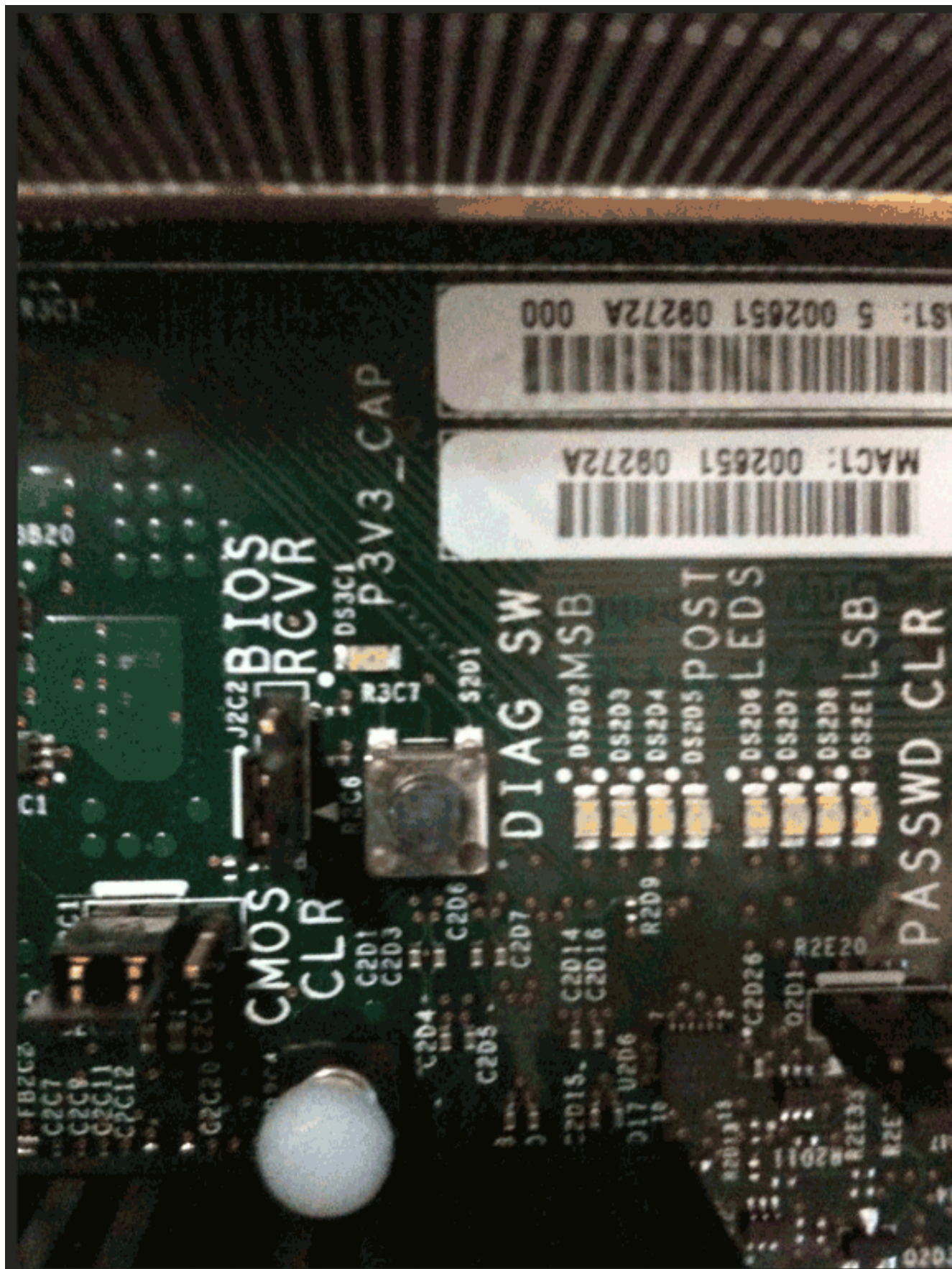
6. 找到故障DIMM。有故障的DIMM用红色LED标识。