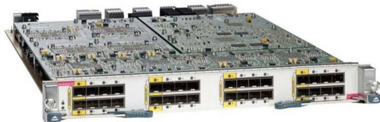
图 1. 配置 XL 选项的 Cisco Nexus 7000 M1 系列 32 端口万兆以太网模块

Cisco Nexus 7000 系列交换机是一个模块化数据中心级产品系列，专为可高度扩展的万兆以太网而设计，其交换矩阵架构的速度能扩展至 15 Tbps 以上，可支持高密度 40 和 100 千兆以太网部署。该系列旨在满足大多数任务关键型网络环境的要求，可提供持续的系统运行和虚拟化普及服务。Cisco Nexus 7000 系列以业界认可的思科® NX-OS 软件操作系统为基础，具备多种强化功能，凭借出众的可管理性和适用性来完成实时系统升级任务。其统一交换矩阵的创新设计专用于支持将 IP、存储和进程间通信 (IPC) 网络整合到单一以太网交换矩阵之上。