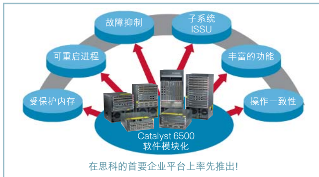
图 2 软件模块化的优势

Cisco IOS 软件模块化可以通过动态地将模块化子系统组合到多个模块化运行进程中，增强 Cisco IOS 的功能。