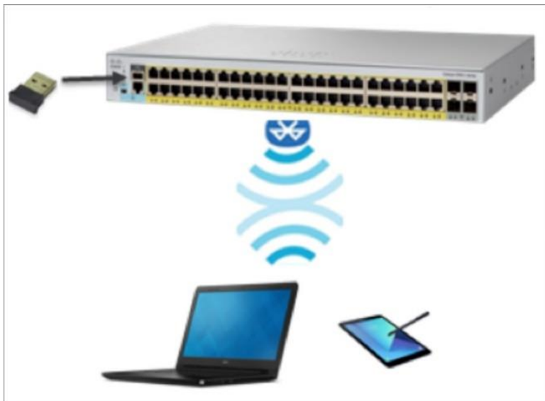
图 2. 使用蓝牙实现交换机无线接入