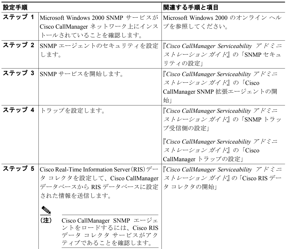
表 18-1 SNMP 設定のチェックリスト