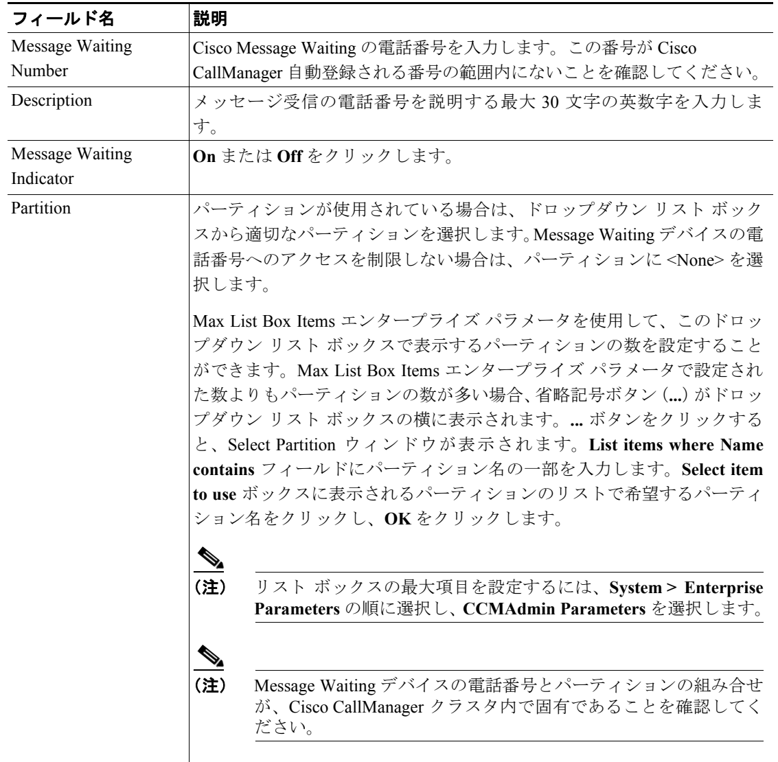
表 64-1 メッセージ受信の設定値