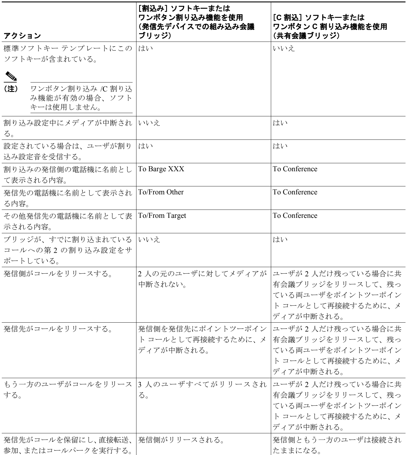
表 1-1 組み込み会議ブリッジと共有会議ブリッジの違い