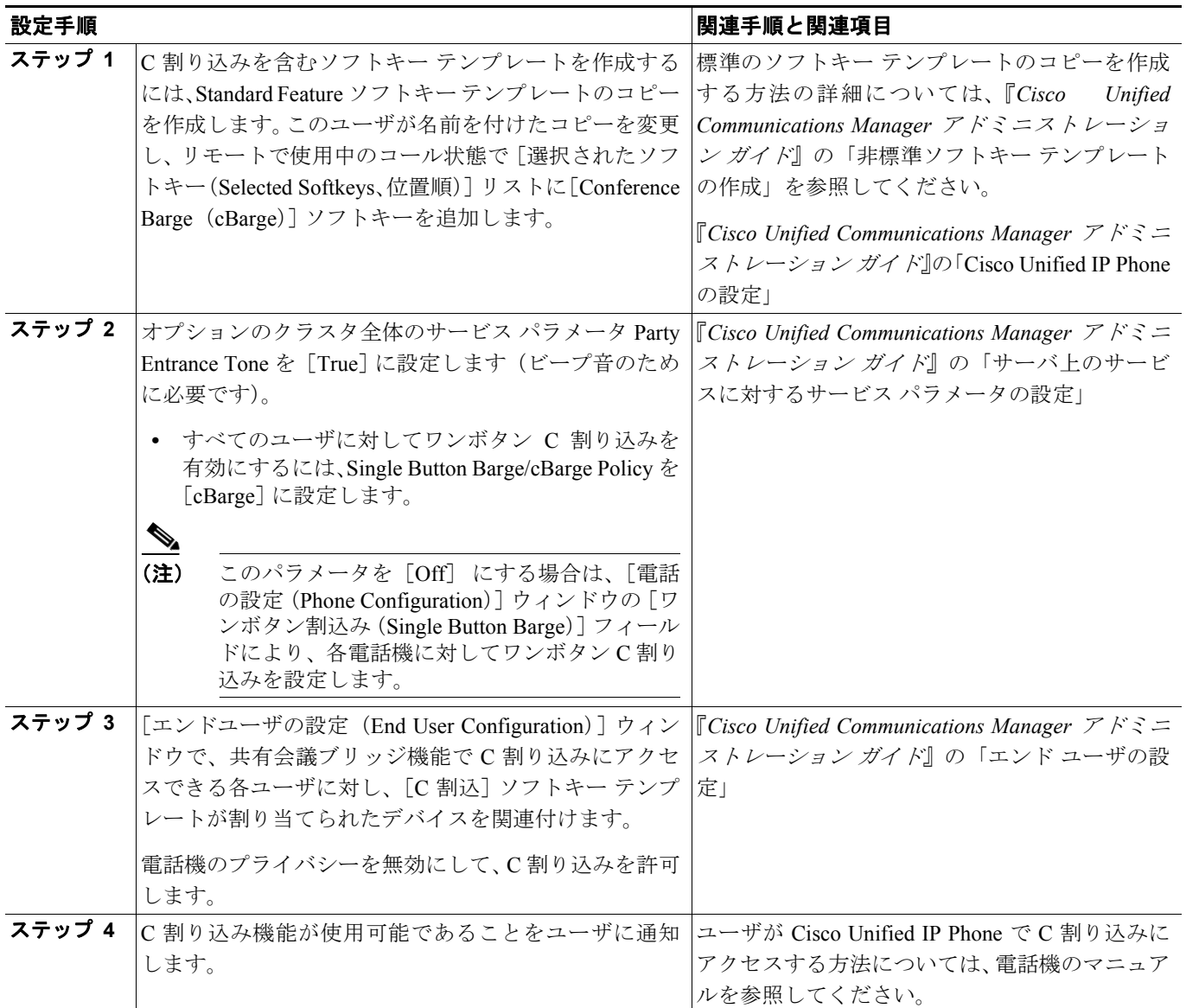
表 1-3 共有会議ブリッジ (C 割り込み) での割り込みの設定チェックリスト

表 1-3 に、共有会議ブリッジで割り込みを設定するためのチェックリストを示します。