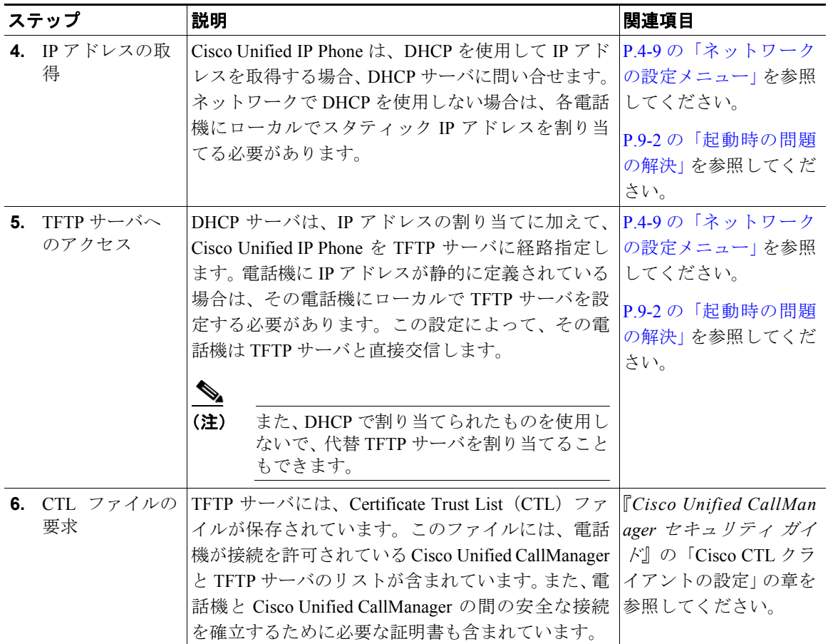
表 2-3 Cisco Unified IP Phone の起動プロセス (続き)