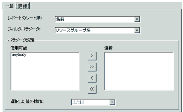
図 4-1 [詳細] レポート設定領域

詳細レポート設定の選択はオプションです。選択していない設定がある場合は、その設定に対応するすべての情報がデフォルトの順序で表示されます。このデフォルトの順序は、[レポートのソート順] フィールドに表示されます。