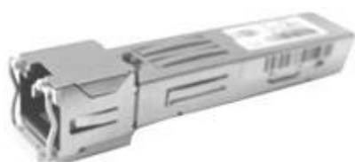
図 1: Cisco 1000BASE-T 銅線 SFP (GLC-T)

サーバにモニタを接続できます。または、Cisco Integrated Management Controller (CIMC) が設定されている場合は、リモート KVMを使用できます (UCS C220-M3 および C220-M4 サーバ上で)。