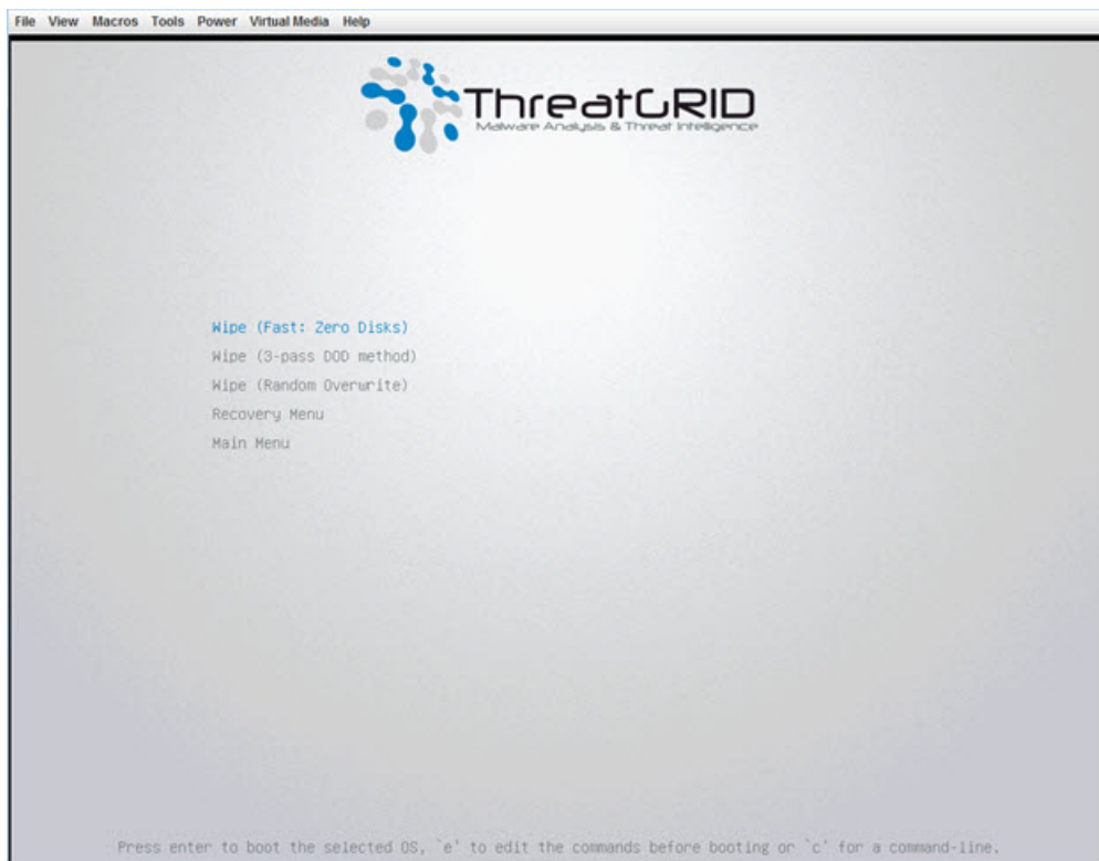
図 2:ワイプオプション