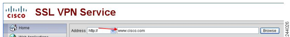
図 1: ユーザが入力した URL の例

デフォルトでは、ASA はすべての Web リソース (HTTPS、CIFS、RDP、プラグインなど) に対するすべてのポータルトラフィックを許可します。クライアントレス SSL VPN は、ASA だけに意味のあるものに各 URL をリライトします。ユーザは、要求した Web サイトに接続されていることを確認するために、この URL を使用できません。フィッシング Web サイトからの危険にユーザがさらされるのを防ぐには、クライアントレスアクセスに設定しているポリシー (グループ ポリシー、ダイナミック アクセス ポリシー、またはその両方) に Web ACL を割り当ててポータルからのトラフィック フローを制御します。これらのポリシーの URL エントリをオフに切り替えて、何にアクセスできるかについてユーザが混乱しないようにすることをお勧めします。