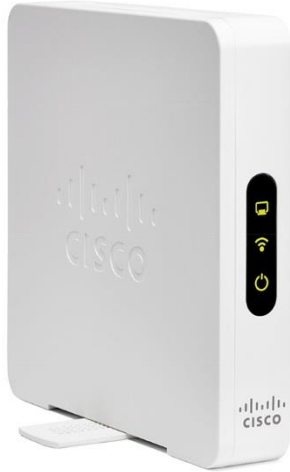
図 2. Cisco WAP131 Wireless-N デュアル無線アクセス ポイント (PoE 対応) の背面パネル