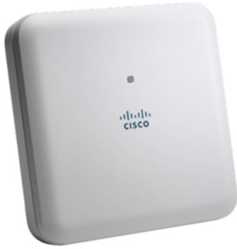
図 1. Cisco Aironet 1830 シリーズ