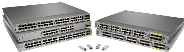
図 2 Cisco Nexus 2000 シリーズ ファブリック エクステンダ

Cisco Nexus 2000 シリーズ ファブリック エクステンダは、1 ギガビット イーサネット、10 ギガビット イーサネット、ユニファイド ファブリック、ラック サーバ、ブレード サーバが混在する環境に、サーバ アクセスを提供するデータセンター製品群の 1 つです。Cisco Nexus 2000 シリーズ ファブリック エクステンダは、管理ポイントを大幅に減らし、データセンターにおけるビジネスとアプリケーションのニーズを満たすことで、データセンターのアーキテクチャと運用を簡素化するように設計されています。Cisco Nexus 2000 シリーズ ファブリック エクステンダと Cisco Nexus スイッチを組み合わせることで、今日のギガビット イーサネット環境をコスト効率よくサポートし、10 ギガビット イーサネットや仮想マシンに対応したユニファイド ファブリック テクノロジーへの移行を容易にします。