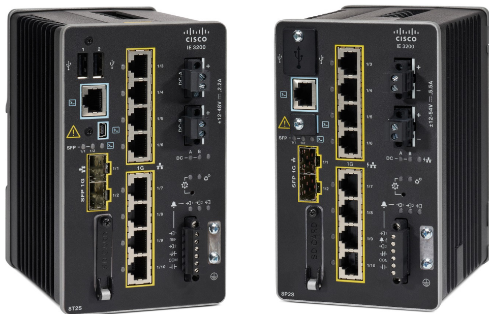
図 1. Cisco Catalyst IE3200 高耐久性シリーズ

IE3200 シリーズは、PoE/PoE+ 用に最大 240W の電力バジェットをサポートし（8 個のポートで共有）、IP カメラ、電話、ワイヤレスアクセスポイント、センサーなどの PoE 受電エンドデバイスの接続に最適です。