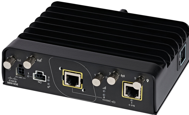
図 1. Catalyst IW9165E 高耐久性アクセスポイントおよびワイヤレスクライアント