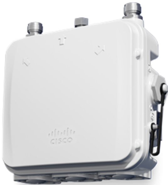
図 2. Catalyst IW9165D Heavy Duty アクセスポイント

Catalyst IW9165D は、ワイヤレスバックホールの導入を簡潔にするために設計されています。内蔵の指向性アンテナにより、光ファイバを使用できない場所であればどこでも長距離、高スループットの接続が可能になるため、固定ワイヤレス インフラストラクチャ（一対一、一対多、メッシュ）の構築だけでなく、沿道や沿線での移動体からの通信をバックホールすることもできます。外部アンテナポートを使用すると、必要に応じてネットワークを新しい場所にすばやく延伸し、用途と導入アーキテクチャに基づいて適切なアンテナを選択できます。耐久性の高い IP67 設計の Catalyst IW9165D は、湿気、ほこり、極端な温度条件下での動作が証明されています。