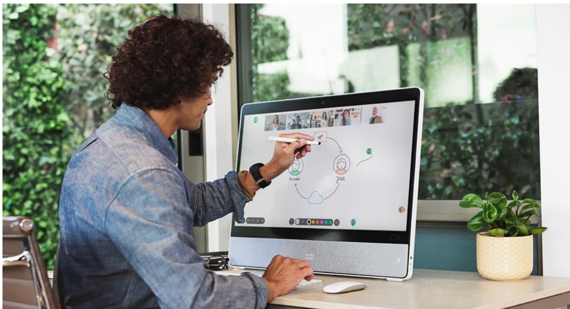
図 1. Cisco Desk Pro を使用したミーティングでのホワイトボード

Cisco Desk Pro は、業界トップクラスのデスクおよび共有スペース向けのインテリジェントなコラボレーションデバイスです。インタラクティブでタッチリダイレクト機能付きの 4K タッチディスプレイを使った、コラボレーション、共同作業、アノテーション作業を可能にします。ネイティブの Cisco Rooms エクスペリエンスで Webex ファーストのエクスペリエンスと高度なサードパーティ製ビデオの相互運用性を実現する場合でも、Desk Pro をネイティブの Microsoft Teams 用に設定する場合でも、Desk Pro はあらゆるデスクに最適です。