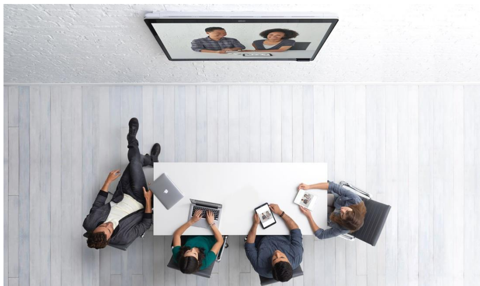
図 2. Cisco Webex Board でのミーティング

Cisco Webex Board 70S* は、高解像度の 4K 70 インチ LED 画面で動作する完全自己完結型システムです。Cisco Spark Board は 4K カメラ、内蔵マイク、および静電容量方式タッチ インターフェイスを統合し、さまざまな規模の会議室に知性、スタイル、使いやすさをもたらします。シンプルさと優美さを考慮して配線を最小限に抑えるように設計されたこのシスコの最新のコラボレーションデバイスは、ワイヤレス共有と Wi-Fi 接続に対応しています。また、タッチベースでさまざまなコラボレーションを容易に実現します。Webex Board は外観も美しく、使いやすいだけでなく、手頃な価格で購入でき、インストールも導入も簡単のため、すべての会議室に設置することができます。