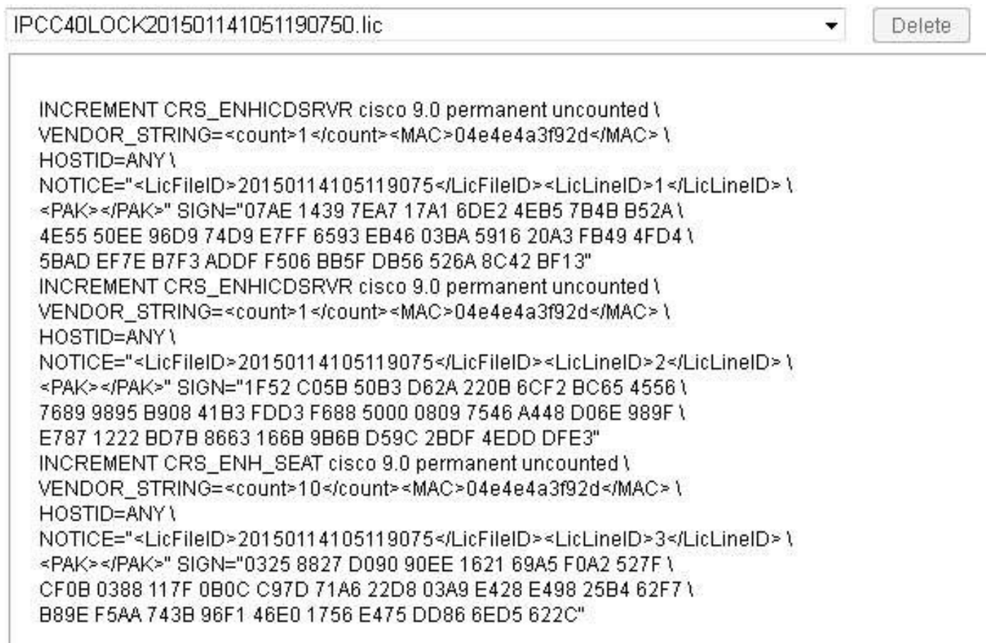
Immagine 3: Contenuto della licenza

Passaggio 3. Quando si visualizzano le informazioni sulla licenza, è buona norma verificare che le funzionalità principali siano corrette. Di seguito sono riportate alcune caratteristiche principali che è necessario verificare in un file di licenza.