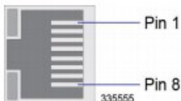
Figure 31. SPIO Ethernet RJ-45 Interface

Aquí se muestra la numeración de la clavija (la imagen muestra el conector RJ45 hembra en SPIO):