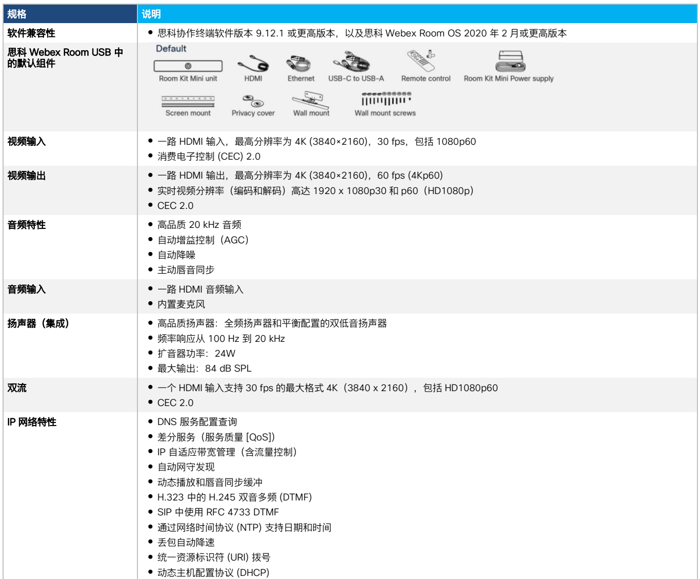
表 3. 规格