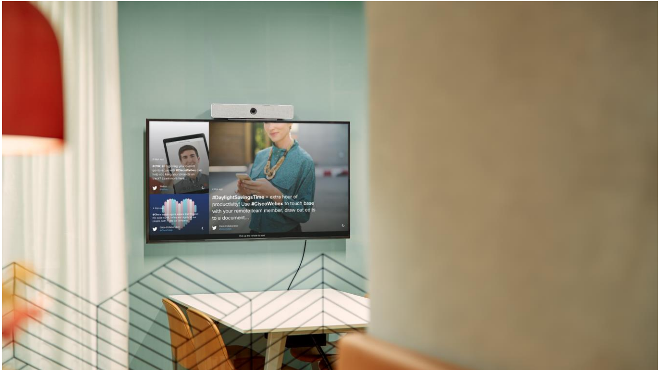
图 2，通过思科 Webex Room USB 实现的数字标牌场景