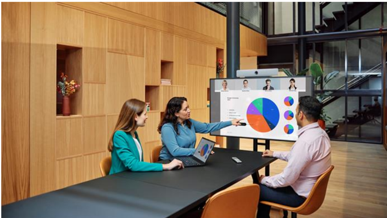
图 1. 思科 Webex Room USB 在开放空间中的应用

思科 Webex Room USB 具有 120 度的水平视角，因此非常适合两到五人的小型团队工作空间，确保会议室中的每个人都可以被清晰地看到（见图 1）。通过 USB 线缆连接到笔记本电脑，Webex Room USB 为视频会议软件客户端的提供高质量的视音频体验和灵活性。