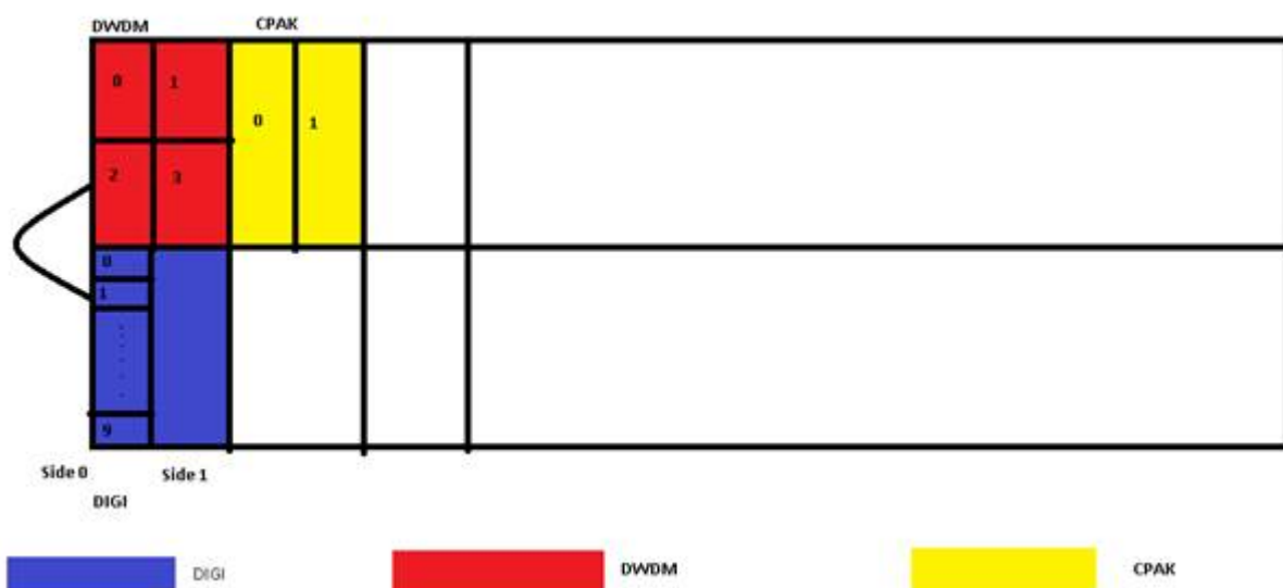
図 4-1 バックプレーン構成