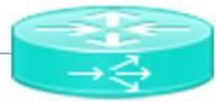
Pagent running on Cisco 3900

ASR1002HX هجوم لىل BGP راسم نويلم عفدل اهمادختسا متي رورم ةكرح دلوم ةادأ وه ليكولوا